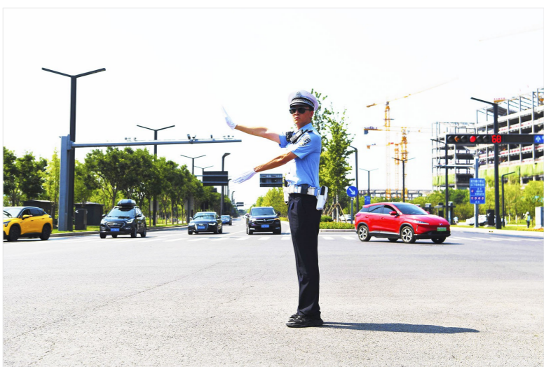
通州采取岗位大比武、重点路口信号灯智能网联联控等措施治理交通拥堵。

此次大比武作为通州区交通拥堵治理工作中的一项内容,对提高全警全员综合业务能力,提升副中心交警整体形象水平起到促进作用。同时,在治理交通拥堵工作中,通州交警支队还将提升智能交通建设水平,推进重点路口信号灯智能网联联控,优化配时,绿波联动;谋划智能交通指挥大脑平台建设,提升辖区通行效能;强化交通组织优化调整,制定专项工作方案,逐点位、逐路段拉列清单,拟定交通组织优化调整措施。此外,主动对接属地政府、城市管理委、公路分局等部门,提升工作合力,设置文明引导员和志愿者,打造全区域文明示范路口。