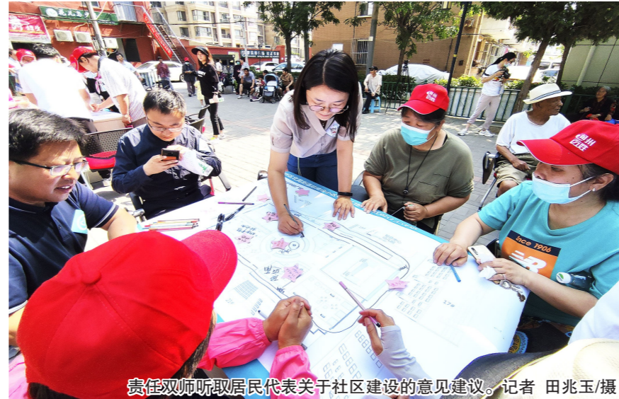
责任双师听取居民代表关于社区建设的意见建议。

心启动责任规划师、责任建筑师工作,成立21支优秀责任规划师、建筑师团队,责任双师团队深入各乡街道,发挥专业技能,帮助属地了解、实施、落实规划。今年,围绕老城双修、老旧小区改造、微空间治理、美丽乡村建设、社区组织培育等工作。