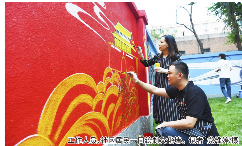
工作人员、社区居民一同绘制文化墙。

高铁、飞机、火箭等图案。“这面墙就像浓缩的中国高铁、航天发展史,既美化了环境,也很有意义。” 据了解,这是北苑街道西关社区打造的手绘墙,总长约75.7米。“我们邀请专业画师和居民一起绘制,展现建党百年以来祖国伟大巨变,手绘墙也让平实的‘老街’焕发新机,成为街头一景。”西关社区负责人表示。