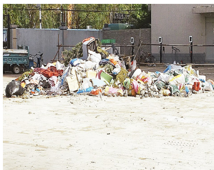
杨庄街道世纪星城东北角