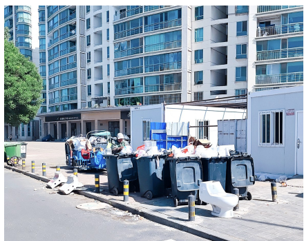
梨园镇通马路旗舰航旋小区西侧底商田老师周边