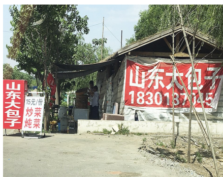
马驹桥镇九周路大杜庄村与小松堡村中间