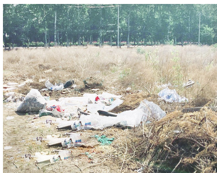
张家湾镇梁上路距京塘路160米处