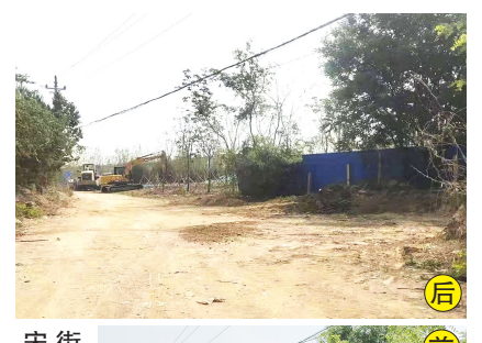
宋庄镇通镇北路与南翼街交叉口东侧