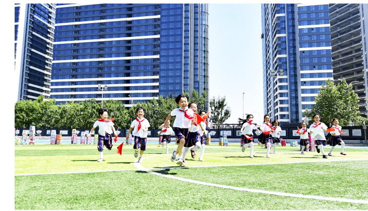
在通州区教师研修中心实验学校,刚加入少先队的同学在操场上快乐奔跑。连日来,全区各小学、幼儿园开展了丰富多彩的庆“六一”主题活动,让孩子们“花样”过节。 记者 张丽/文