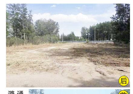
通燕高速北侧瀛城三惠桥桥东侧