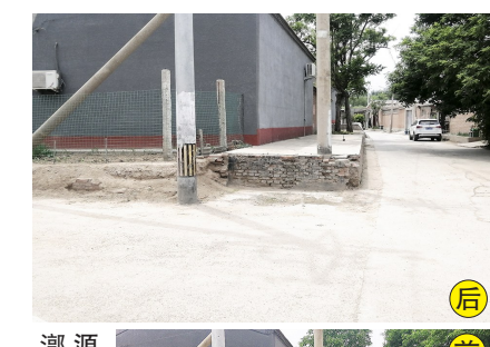
源堂大药房周边潮县镇魏庄村北京碧