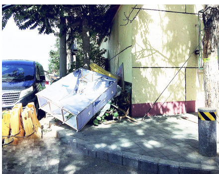
九棵树街道玉桥路南延路大个饺子馆周边