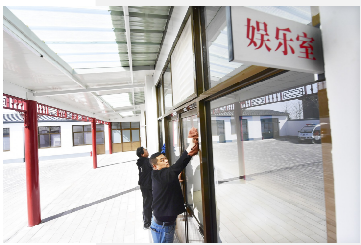
德仁务前街村将村内一处废弃沼气站改造成为可就餐、娱乐、健身的养老服务驿站。

按照本市相关标准,服务流量补贴按照不低于服务总收入50%的比例予以资助,即驿站每收取老年人100元费用,政府给予50元的补贴。对于农村养老驿站以及经政府同意,运营方利用自有设施或租赁设施用于社区养老服务驿站建设运营的,按照实际服务流量补贴的1.5倍予以资助,也就是说驿站每收费100元,政府将给予75元补贴。“服务越多,补助越多,这样做有助于防止驿站不积极主动开展业务而依靠运营补贴勉强生存,造成设施资源的浪费。”民政局福利科有关负责人说。