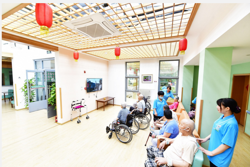
潞城镇养老照料中心内,老人们看电视放松身心。

大赛最终评出中山街社区养老驿站E生活、北京诚和敬驿站“我的菜园在郊区”、通州瀚丰居家养老服务社区驿站+双导流养老服务驿站等10个“好项目”。接下来,还将为辖区内有想法、有创新的养老服务驿站服务商提供项目资金支持和专家指导,激发城市副中心养老服务驿站服务单位的积极性与创新能力,形成可复制可推广的副中心模式与经验,未来推广到“北三县”等京津冀地区,推动养老事业协同发展。