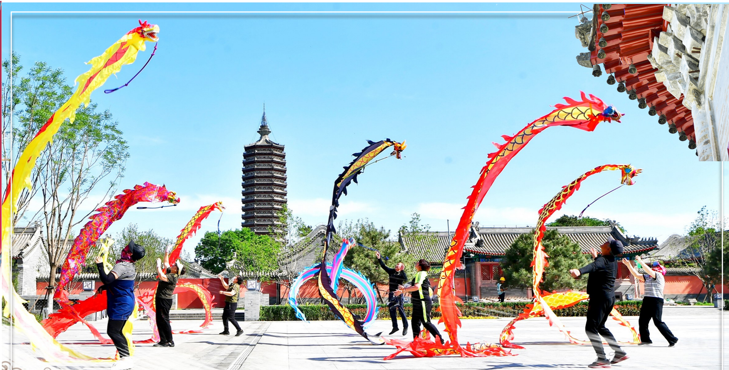
“三庙一塔”旁的休闲广场上，舞龙高手们欢快舞动。