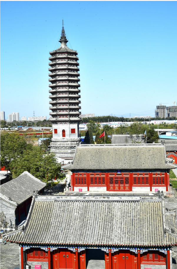
蓝天下的“三庙一塔”景区古色古香。