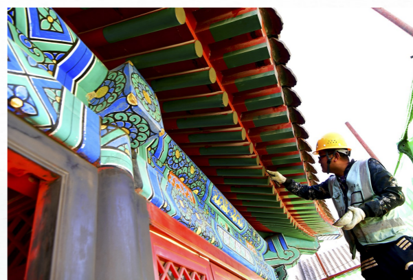
工作人员对文庙彩绘进行修缮。

通过区域整体化的挖掘保护开发利用，这里最终将被打造成集古城保护、文化旅游、绿色生态、滨水宜居为一体的城市新地标、文化金名片、发展新高地，辐射带动整个城市副中心建设和大运河文化的保护、传承和利用。