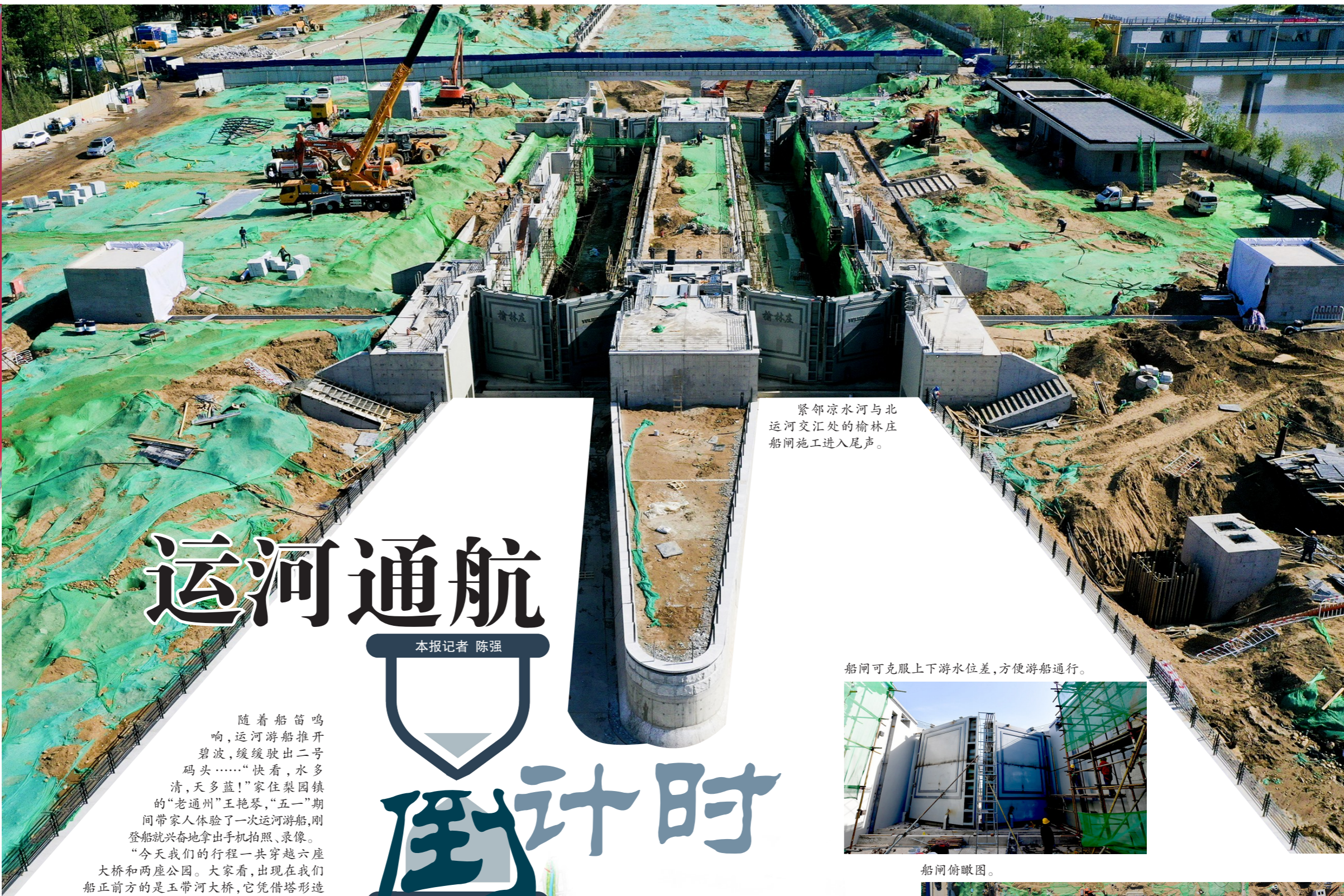
紧邻凉水河与北运河交汇处的榆林庄船闸施工进入尾声。