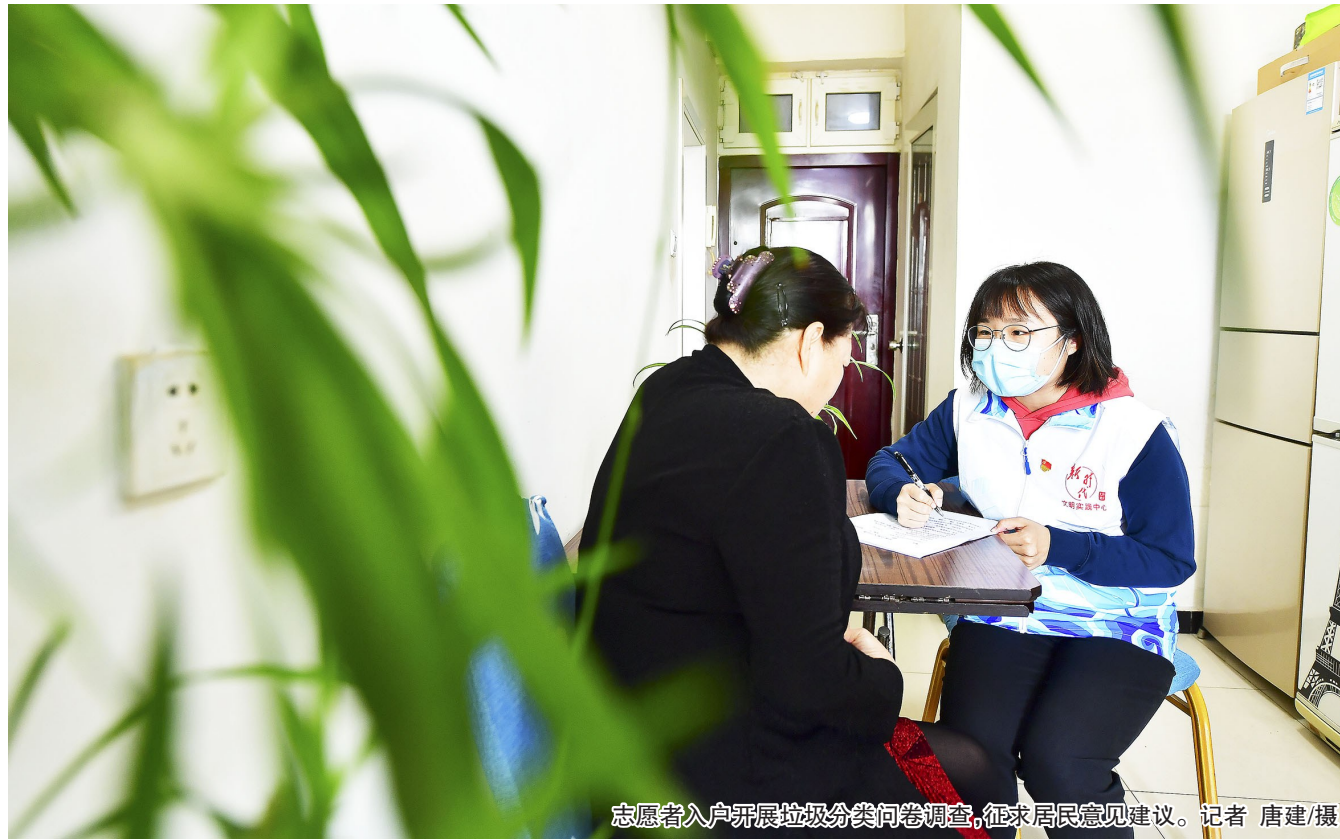
志愿者入户开展垃圾分类问卷调查,征求居民意见建议。

记者了解到,自4月24日起至4月30日,全区将集中开展“助力垃圾分类大回访”志愿服务活动,将垃圾分类志愿服务纳入党员回社区(村)报到的日常活动内容,引导党员志愿者指导居民