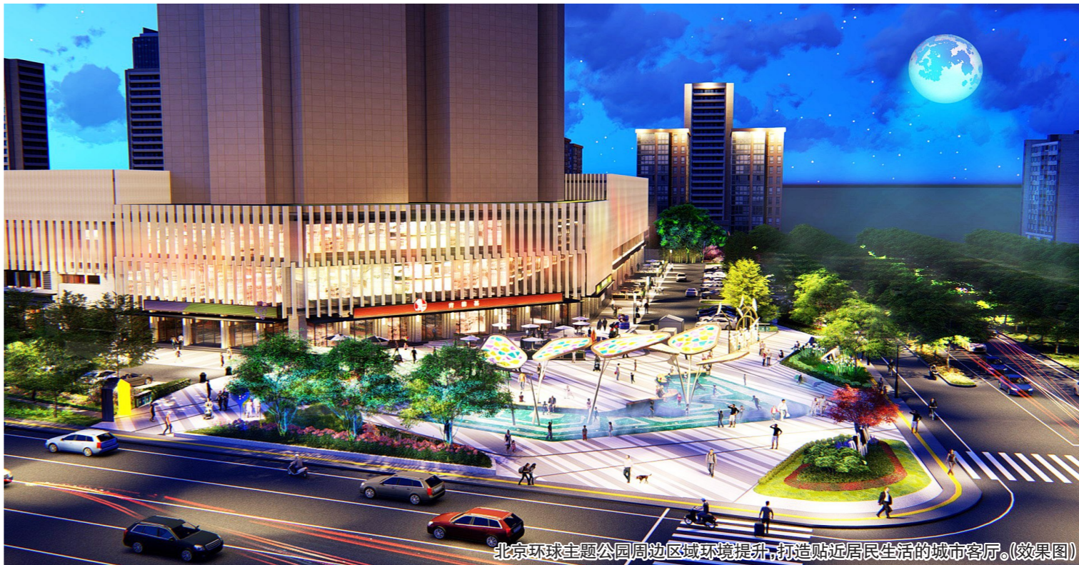
北京环球主题公园周边区域环境提升,打造贴近居民生活的城市客厅。(效果图)

今年,城市副中心更以街区为单元,将改造与街区更新、老旧小区整治相衔接。以“点”突破,以“线”带动,以“面”覆盖,将168条背街小巷整治,由单一街巷变“组团式”连片提升。