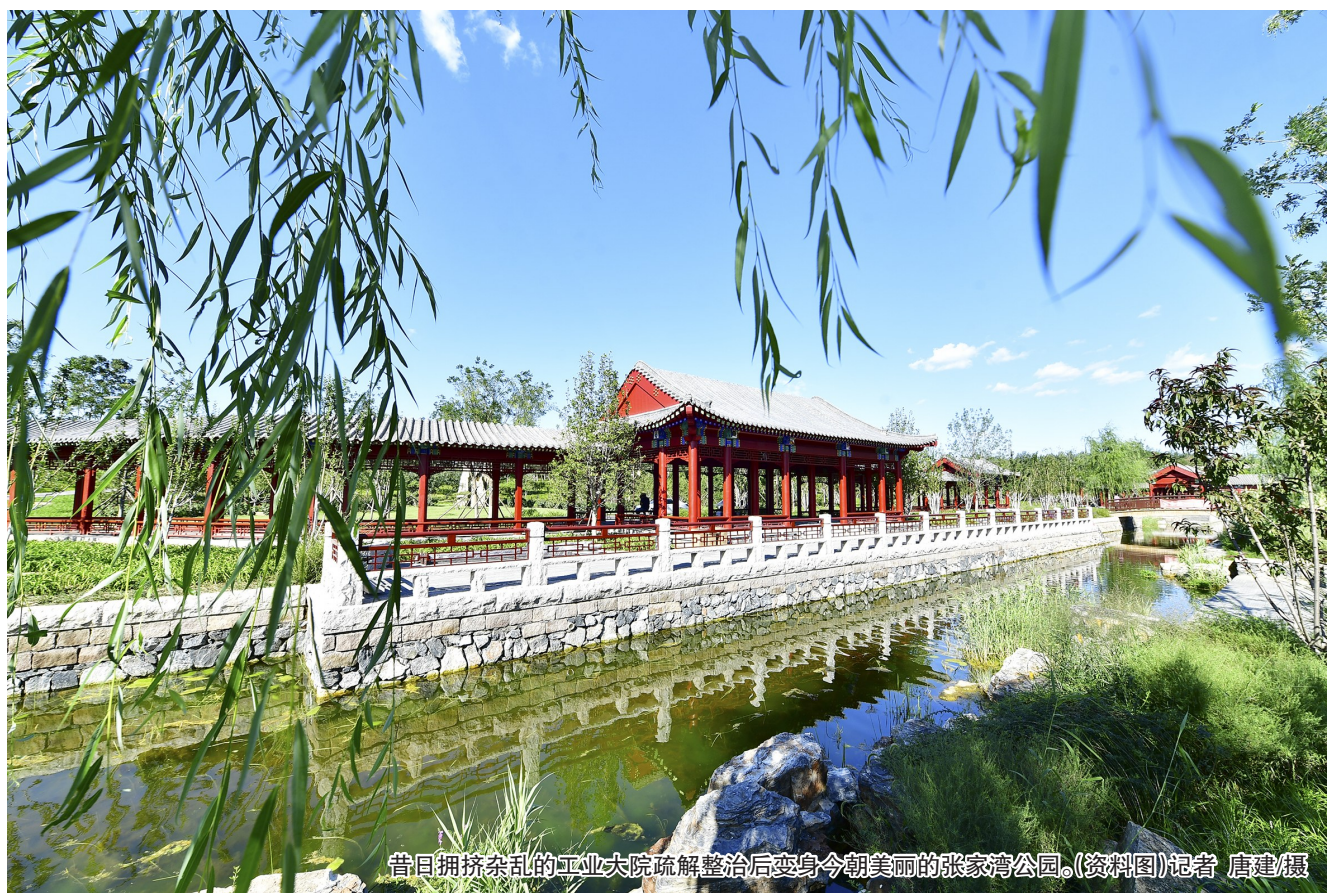
昔日拥挤杂乱的工业大院疏解整治后变身今朝美丽的张家湾公园。(资料图)记者 唐建巍

城区东部的朝阳则主要是“见缝插绿”,在寸土寸金的都市里,为森林“挤”出生长空间。“经过前几年大刀阔斧的大尺度绿化,面积大的地块大多已被上绿装。四环、五环路之间多了23个郊野公园,城市第一道绿化隔离带在朝阳区率先贯通。”朝阳区园林绿化局相关负责人说,越往后越是难啃的“硬骨