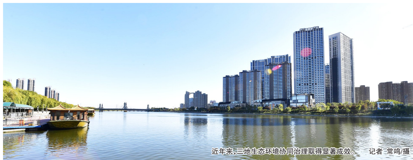
近年来,三地生态环境协同治理取得显著成效。

2019年1月,习近平总书记主持召开京津冀协同发展座谈会时要求,坚持绿水青山就是金山银山的理念,强化生态环境联防联控。目前,在探索合作机制上,三地生态联防联控已取得一些新突破。”谷树忠举例说,近年来,京津冀三地与山西、国家开发银行等共同成立永定河流域投资公司,通过资金整合、专业生态服务等方式,造就越来越多的绿水青山,并促进绿水青山向金山银山的转化,再通过转化来的金山银山,造就更多的绿水青山,实现良性循环和“两山”兼顾,“这个模式的优势已初步显现,实施主体明确,责任主体明确,服务也更加专业。”(下转2版)