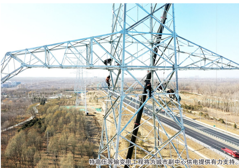
特高压输电工程将为城市副中心供电提供有力支持。

理工程和北运河船闸建设工程(打捆),以及能源设施北京东特高压—通州500千伏送出工程的北京段,通州北500千伏变电站工程、