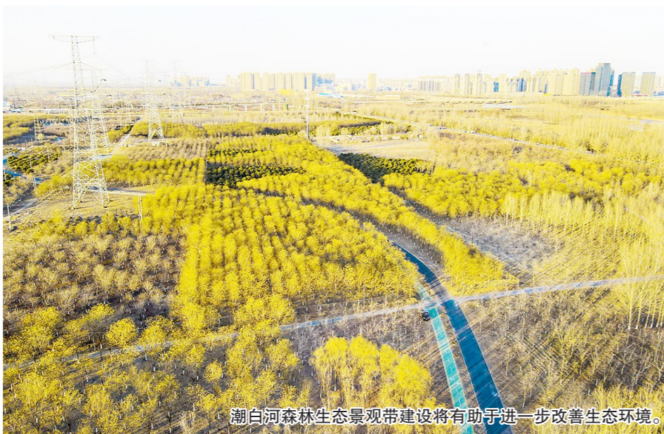
潮白河森林生态景观带建设将有助于进一步改善生态环境。

今年北京城市副中心新添学校数目将增至4所,医疗、养老院区增至8所,文体项目增至8个,以及生态绿化、城市更新项目3个。