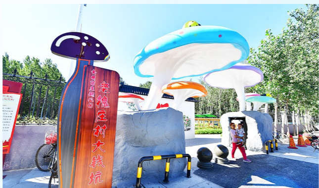
老槐庄村结合产业发展,打造蘑菇主题公园。