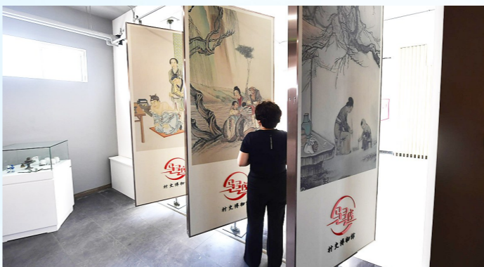
村史馆为村民留住乡愁。