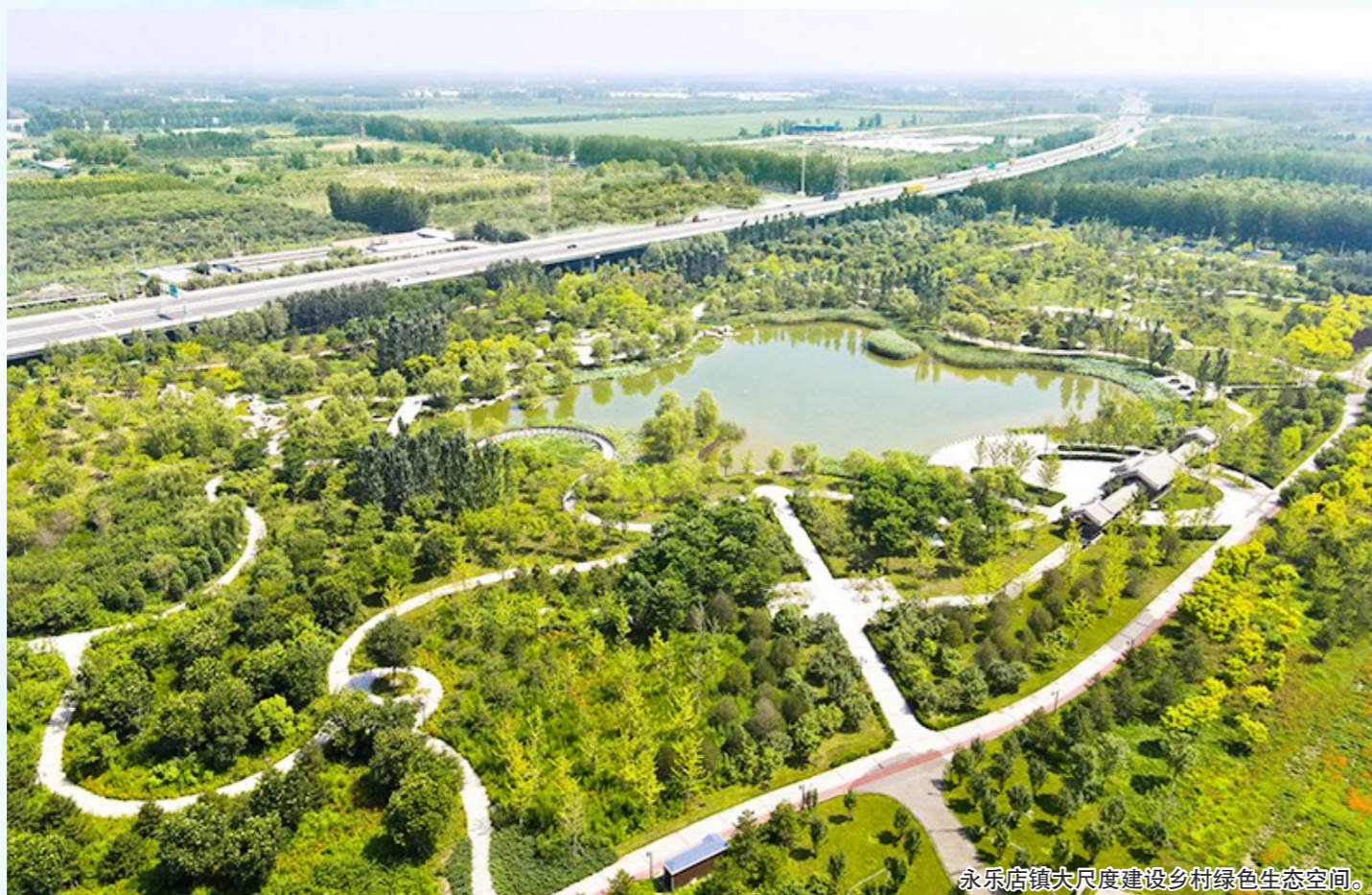
永乐店镇大尺度建设乡村绿色生态空间。

“十三五”期间,永乐店镇大力推进农村人居环境整治,以美丽乡村建设为契机,建立长效管理机制,提升村庄精细化治理水平,全面完善农村基础设施和公共服务设施,打造村庄特色文化品牌,探索产业发展新模式,为村民致富增收再添动力,全面提升村民的幸福感受。