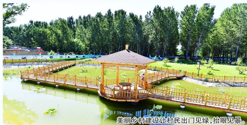
美丽乡村建设让村民出门见绿,抬眼见景。