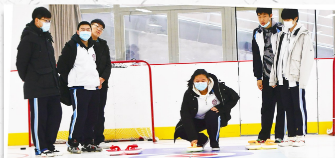
学生们在陆地冰壶课上感受冰雪运动的乐趣。

目前,城市副中心的史家小学通州分校等13所学校成为北京2022年冬奥会和冬残奥会奥林匹克教育示范学校,潞河中学等13所学校成为北京市冰雪运动特色学校。这些特色校或聘请专业速滑教练为学生授课,或带领学生观看冰雪比赛,因地制宜地推广冰雪运动。还有不少学校陆续开设滑冰、轮滑、冰球、陆地冰壶等课程,深受学生喜爱。一些学校还组建了冰雪社团,对学生进行冰球、冰壶以及滑雪的集中训练,为学生参加各项赛事创造条件。