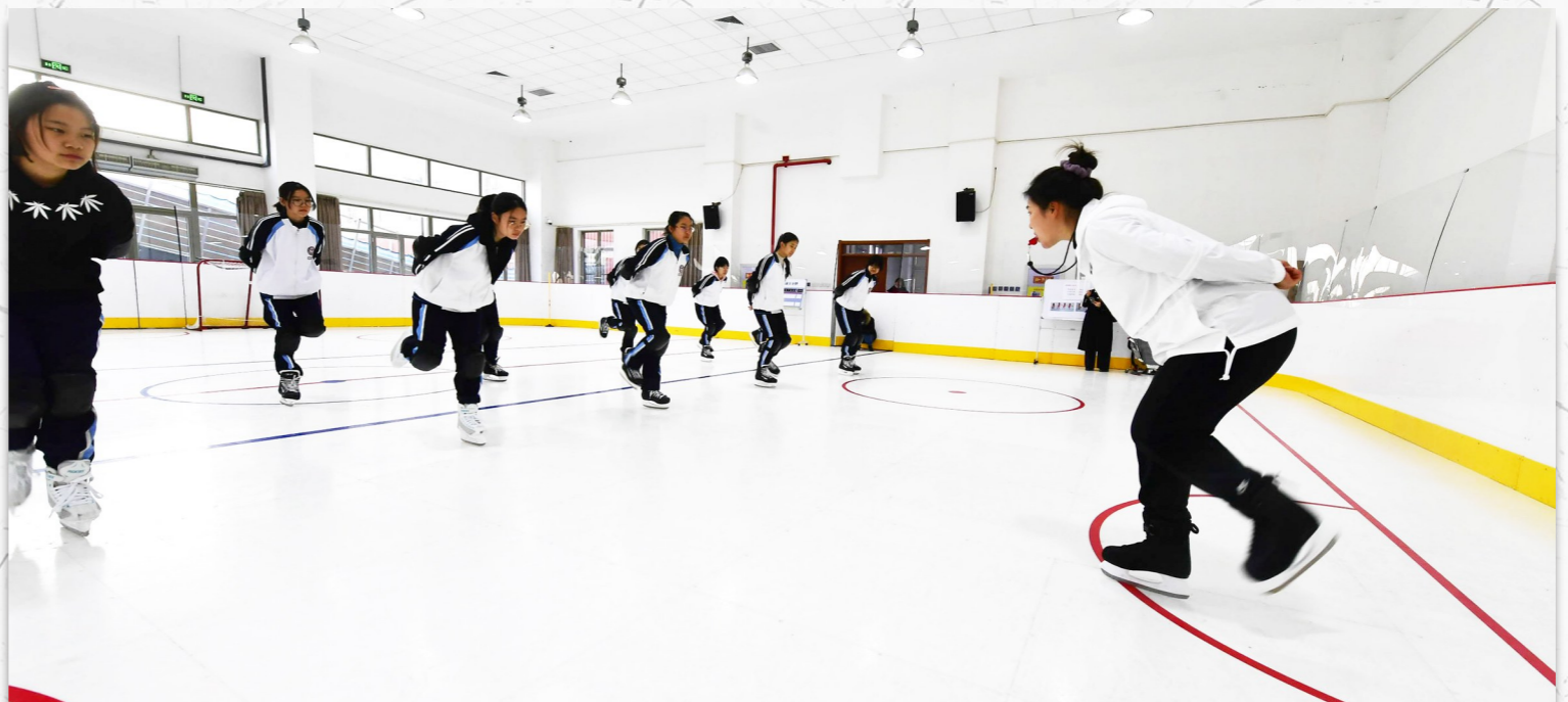
课上,体育老师带领学生们练习滑冰动作。