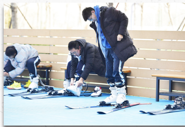
学生们换上冰鞋、雪鞋,做好课前准备工作。