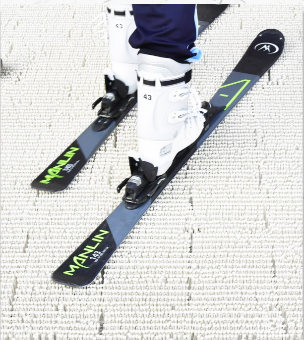
仿真雪道让孩子们一年四季都可以练习滑雪。