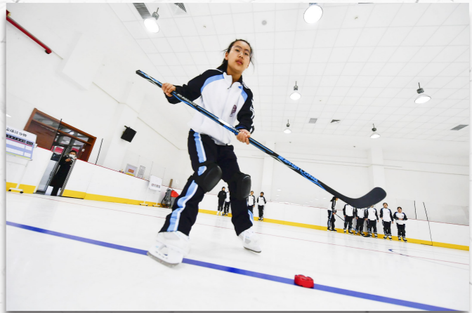
一名学生正在进行冰球击打训练。