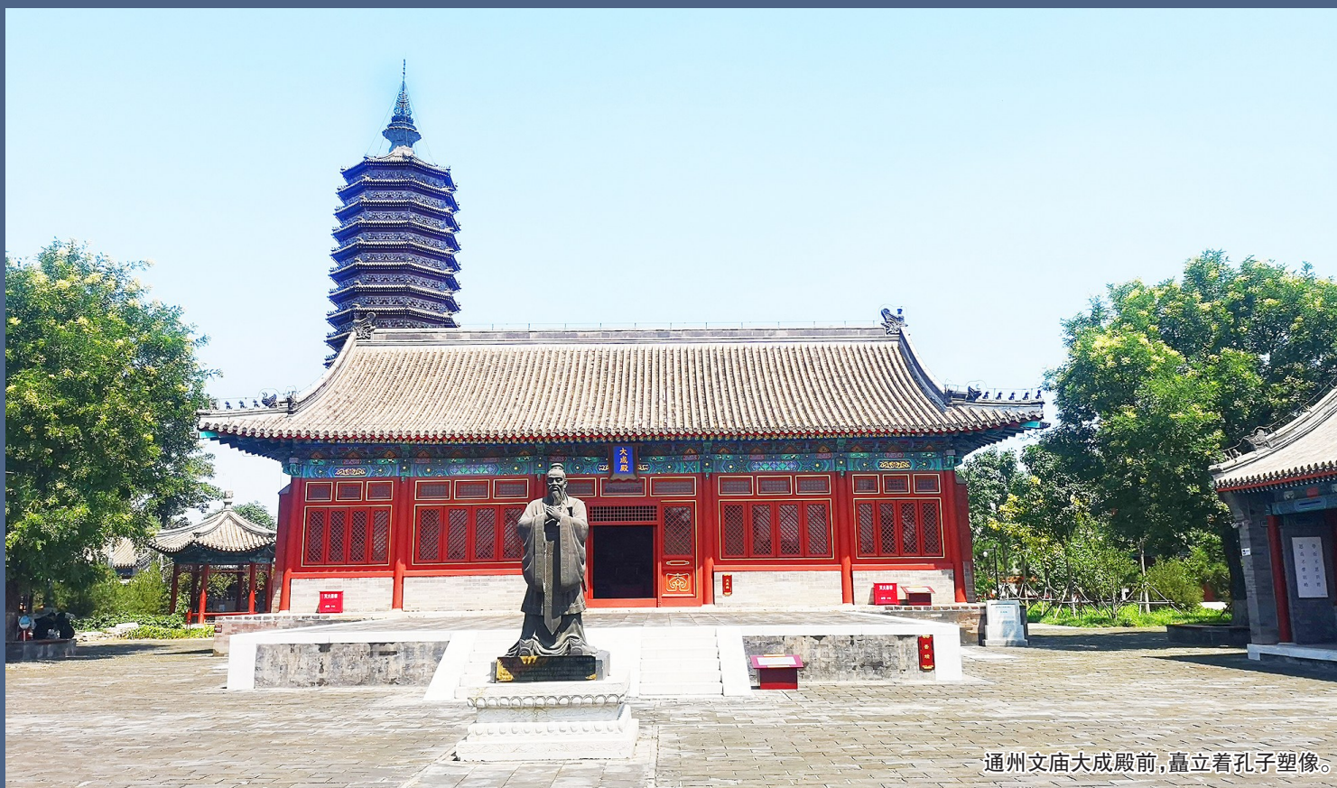
通州文庙大成殿前，矗立着孔子塑像。

通州文庙的建造时间比北京孔庙还早4年，通州贡院曾是27个州县的生员考试的场所，从这里走出去的文人举子数不胜数。在古代通州的运河西畔，还有不少颇具地方特色的代表性教育场所——书院。比如明代巡仓御史阮鄂在通惠河畔创办的通惠书院，清代通州知州朱英创立的官办潞河书院。此外，通州还有双鹤书院、闻道书院、杨行中书院。这些位于大运河西畔的众多书院汲取着大运河文化的营养，使通州地区的文脉更加旺盛。