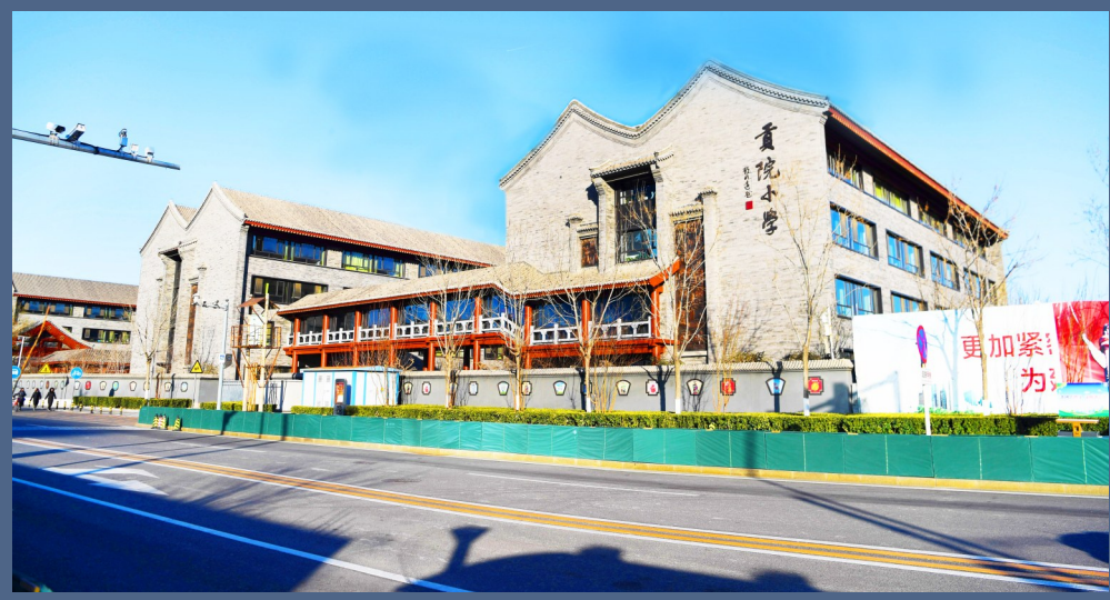
贡院小学的老校址就是古代的通州贡院，后来旧城改造时搬到现址。

光绪二十九年(1903)，原通州贡院的空地平整为通州官立小学堂操场用地，这片通州文脉的沃土再次涅槃重生。后来，通州贡院原址成为通州贡院小学校舍用地。2010年，通州老城改造，通州贡院小学搬迁至西南一里现址继续办学，老校址另作他用。