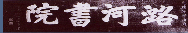
“潞河书院”木匾额珍藏于潞河中学校史馆的二层。

在通州的历史上，曾出现过两座书院。其中，先后有两座创办于通州老城以外的“潞河书院”。前者是具有中国传统意义上的书院，后者则是近代西学东渐的产物，相当于教会学校。