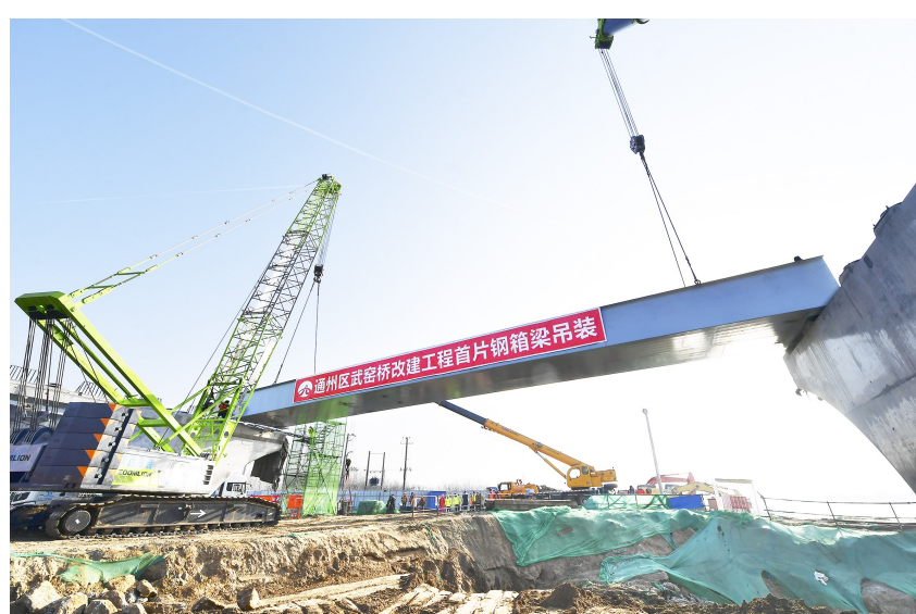
昨日上午,武窑桥改建工程首片钢箱梁开始吊装。

北运河串联城市副中心和若干小城镇,是水绿空间格局重要骨架,是塑造蓝绿交织、清新明亮特色风貌的关键性空间廊道,同时也是大运河文化带的重要组成部分。武窑桥改建工程是实现北运河(通州段)全线通航的重点工程之一,新武窑桥建成后,将服务于两岸地方车辆的交通转换需求,同时也将成为大运河上一道靓丽的风景线。