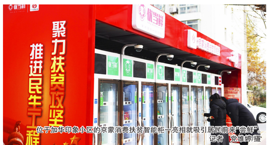
位于加华印象小区的京蒙消费扶贫智能柜一亮相就吸引居民前来“尝鲜”。

本报讯(记者 郭丽君)昨天,在新华街道加华印象小区内,不少遛弯的居民被一排无人售货柜吸引,不时有人掏出手机扫码购买。作为促进消费扶贫的方式之一,最近,京蒙消费扶贫产品智能柜已在该街道3个社区安家。