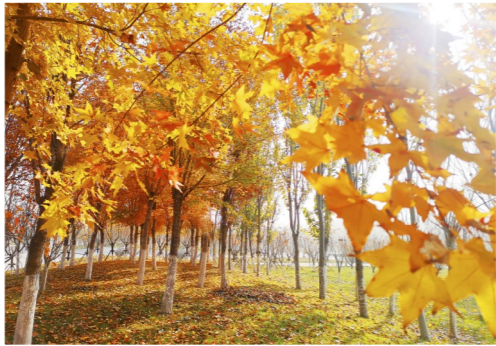
潮白河樱花公园内的枫树迎风摇曳。