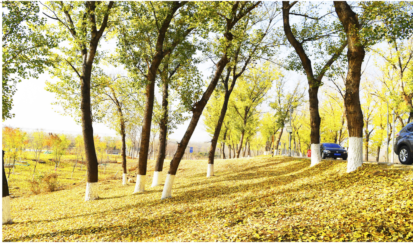
西集潮白河大堤路两旁,金黄的树叶撒落一地。