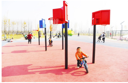
万亩银杏林内的儿童乐园吸引孩子前来打卡。