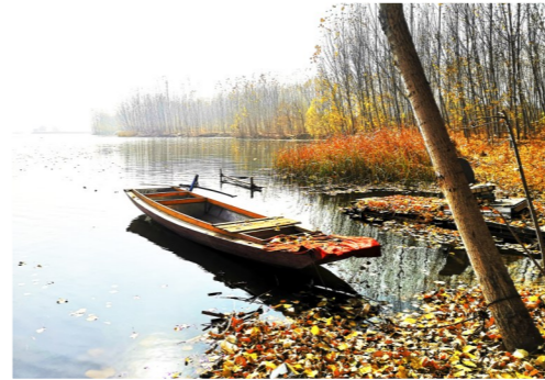
昔日摆渡船闲置,成为河边一景。