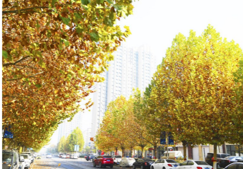
大厂居民小区附近的“梧桐大道”。