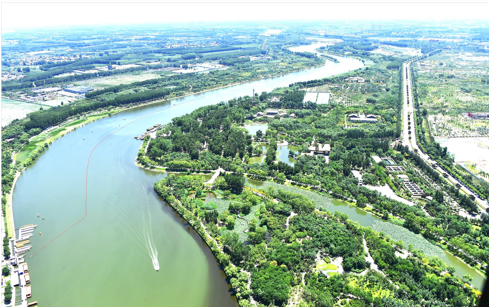
京津冀将建三地互通机制,共享水文数据、施工进度等,确保大运河通航。(资料图片)