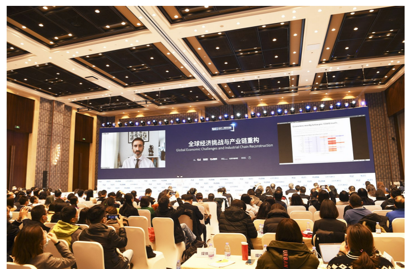
国外专家连线财经年会。年会期间,将有70余名国内外政商界专家学者,就“全球经济挑战与产业链重构”等十个专题进行交流讨论,全面展望2021年全球及中国经济、政治、社会、科技新趋势。

据了解,作为北京市服务业扩大开放综合试点先行区,北京城市副中心正全面加强金融服务领域改革创新,推动数字经济和数字贸易发展,发挥政策集成优势,承接北京中心城区商务区服务功能疏解,积极开展跨境金融服务便利化,探索开展排污权、水权、用能权等绿色金融业务,加快打造北京全球财富管理和绿色金融创新的重要承载区。