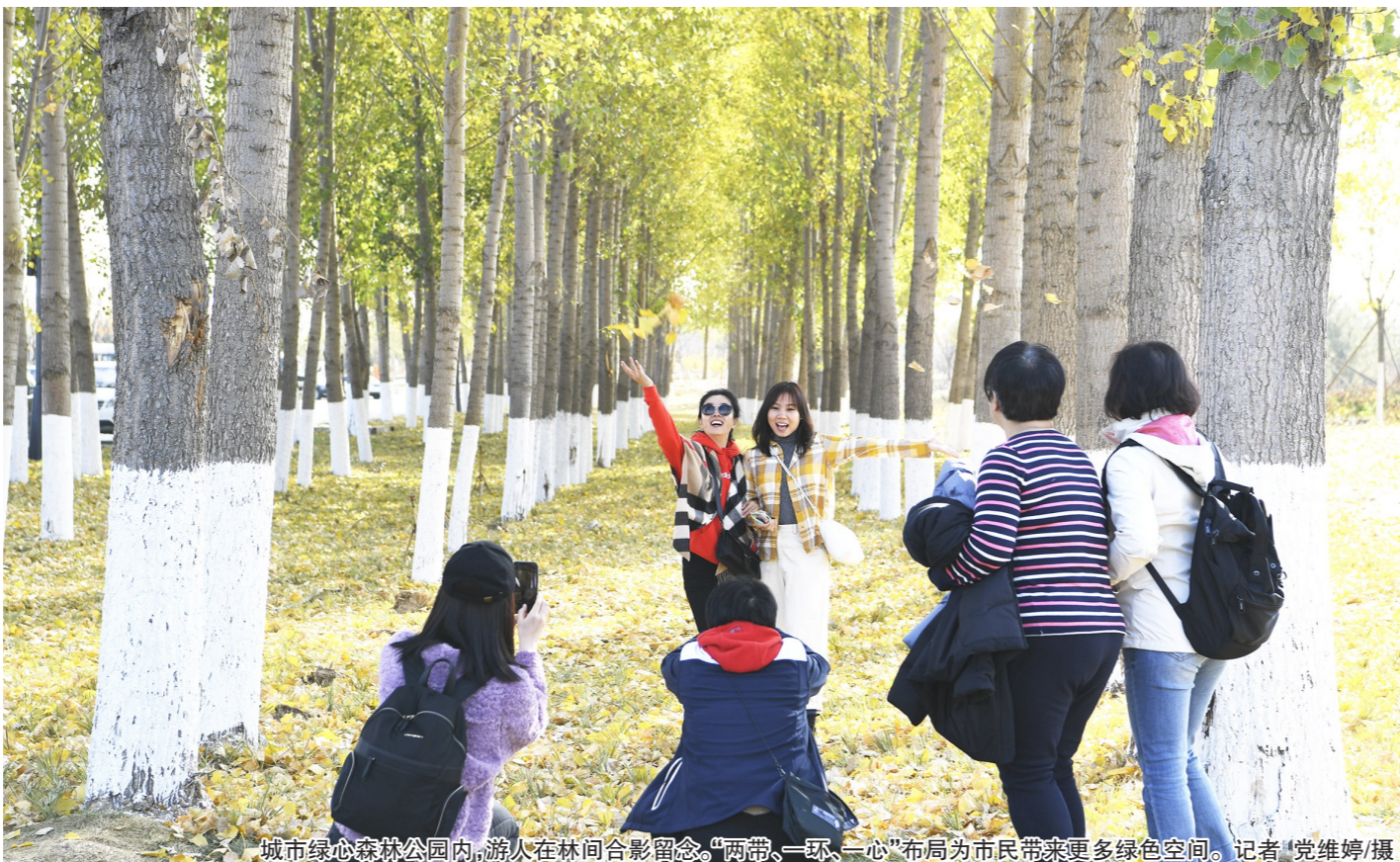
城市绿心森林公园内,游人在林间合影留念。“两带、一环、一心”布局为市民带来更多绿色空间。

数据显示,与2017年相比,通州区的森林覆盖率由28.4%提升到33.02%,城区绿化覆盖率由34.65%提升到51.02%,城区人均公园绿地面积由10.29平方米提升到19.30平方米,城区公园绿地500米服务半径覆盖率由70.16%提升到91.46%。(下转2版)