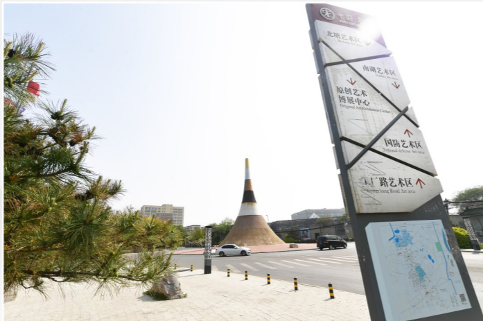
升级改造后,小堡将增补公共服务设施,营造绿色生态环境。

绿色生态是小堡艺术区城市设计的另一大亮点。利用现有的空地和绿地资源,艺术区内将营造600个生态院落,24处小微绿地、6条结构性生态绿廊、80公顷中央艺术绿野,另外还有150米宽的带状生态屏障。以绿色空间为基底,构成生机勃勃的“艺术之原”。