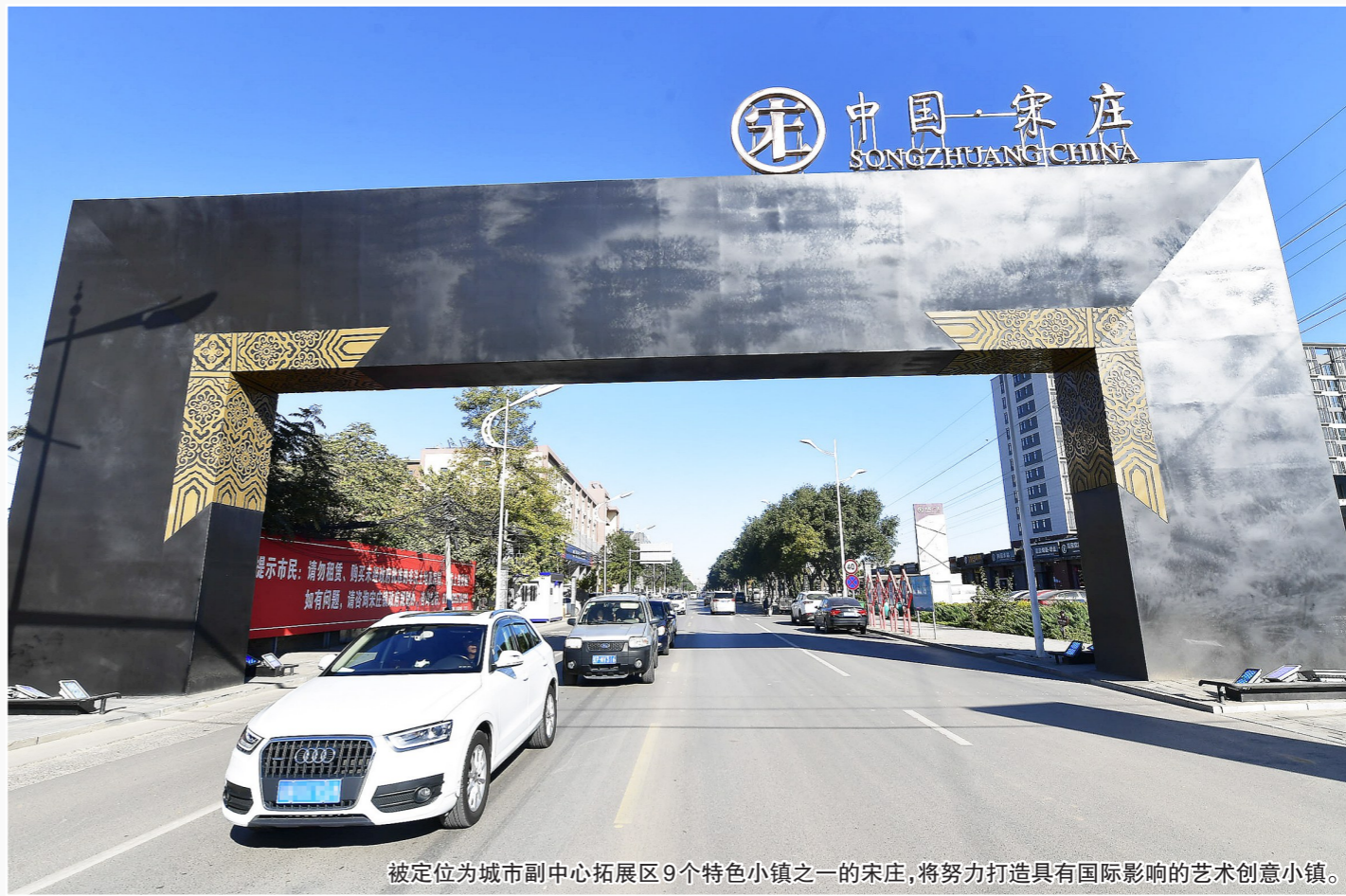
被定位为城市副中心拓展区9个特色小镇之一的宋庄,将努力打造具有国际影响的艺术创意小镇。