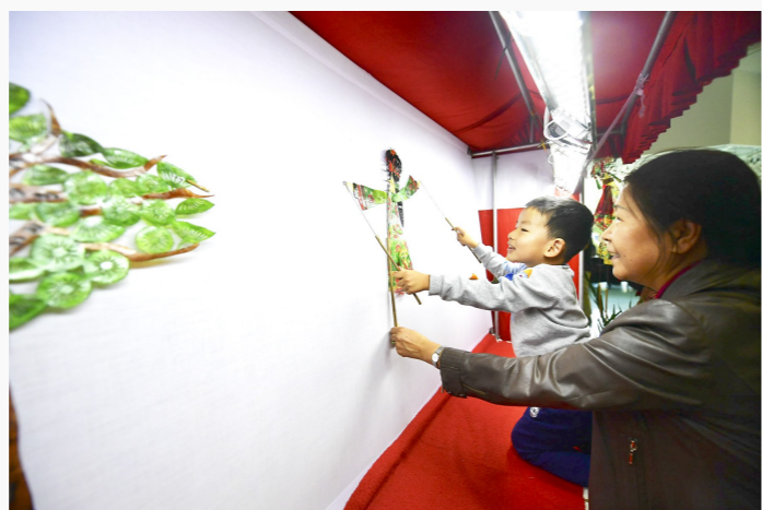
艺博会期间,观众欣赏各类艺术展之余体验皮影操作。