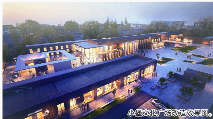
小堡文化广场改造效果图。