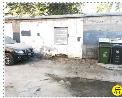
马驹桥镇西街村百顺超市南侧