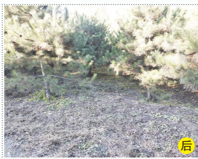
台湖镇蒋辛庄村东南林地中