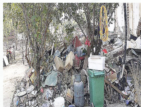
张家湾镇立禅庵村堆物堆料

着力构建共管共治长效机制,营造干净整洁、规范有序、舒适宜居的农村人居环境。近期,通州区城市管理委结合农村人居环境和美丽乡村建设工作,进一步加大垃圾无序堆放、垃圾清运处理体系不完善、环卫设施不健全、拆违区域场不净、围挡破损等影响村容村貌问题的检查力度,发现问题及时通知属地整改。 本期选取了6处上期挂账督办的环境问题,刊登前后对比照片,并对新发现的6处环境问题挂账督办。