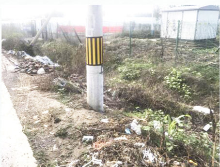
潮庄镇大香仪村路边乱倒垃圾