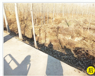
永乐店镇前街村东基本农田公示牌东200米无名路边沟