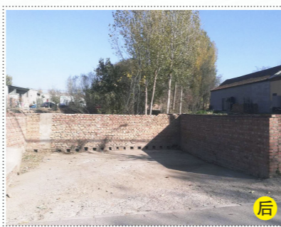
潞城镇太子府319号南侧