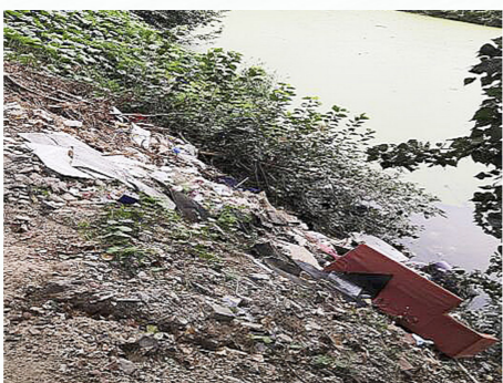
宋庄镇葛渠村坑边乱倒垃圾