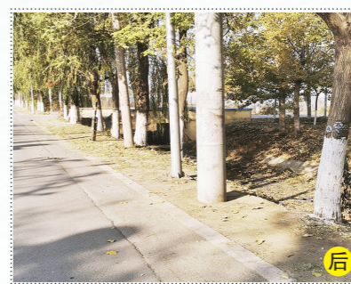
潮庄镇小香仪村东侧潮大道路沿线