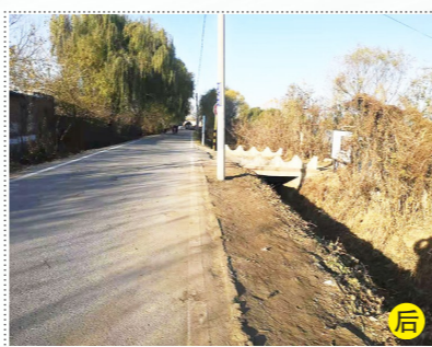
张家湾镇牌楼营村南侧牌楼营路