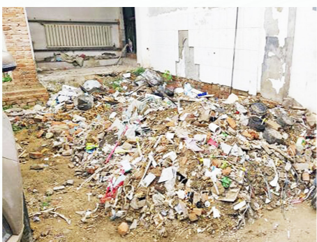
马驹桥镇辛屯村建筑垃圾