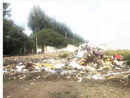
潮庄镇高庄村乱倒垃圾