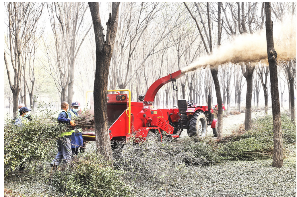
在潞城镇林场，护林员们将枯枝烂叶投放进破碎机打成碎屑，这些碎屑和肥料搅拌在一起可以制成有机肥。

据了解，目前全市已经建成30个新型集体林场，已经有32万亩生态林纳入新型集体林场管护范围。明年，新型集体林场建设将在全市广泛推开。