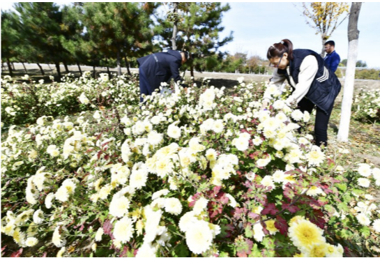
今年种植的林下中草药中，菊花可率先采摘。

一朵朵饱满的菊花，泡开后清香阵阵。在潮县镇军屯村，今年首次尝试种植的150亩林下经济作物中，菊花率先长出“小成果”。