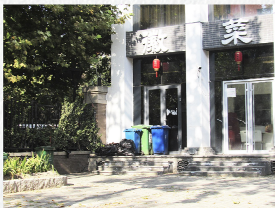
通运街道玉带河大街京徽苑门前生活垃圾