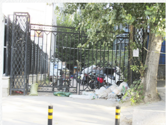
新华街道朝晖西街新华超市西侧生活垃圾