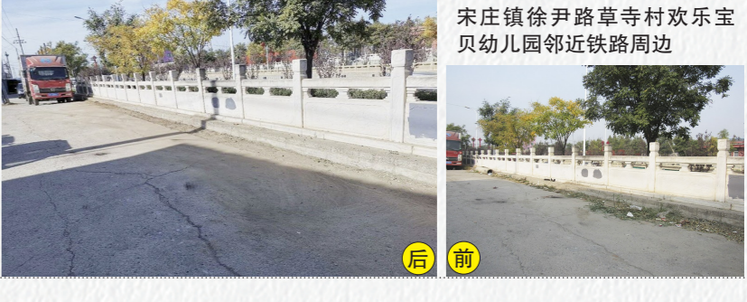
宋庄镇徐路草寺村欢乐宝贝幼儿园邻近铁路路边