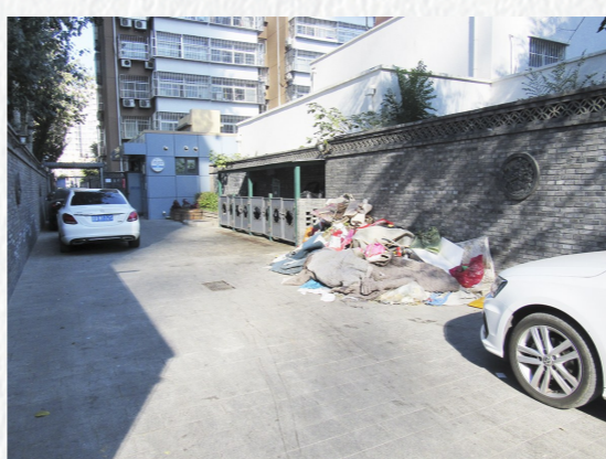
北苑街道北苑连店路店堆物堆料