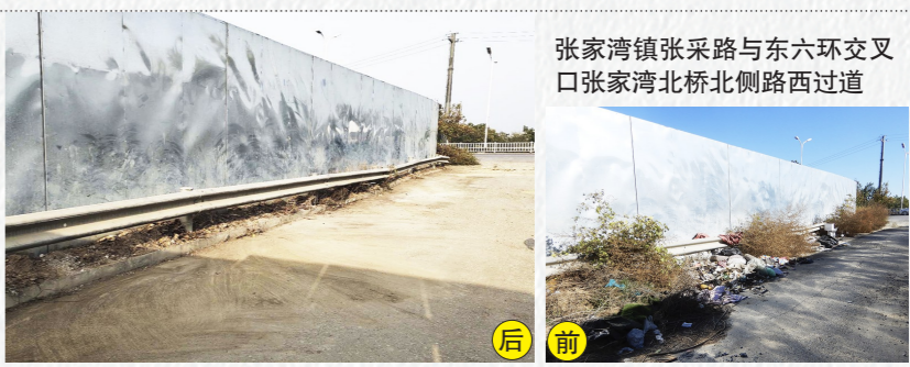
张家湾镇张采路与东六环交叉口张家湾北桥北路西过道口