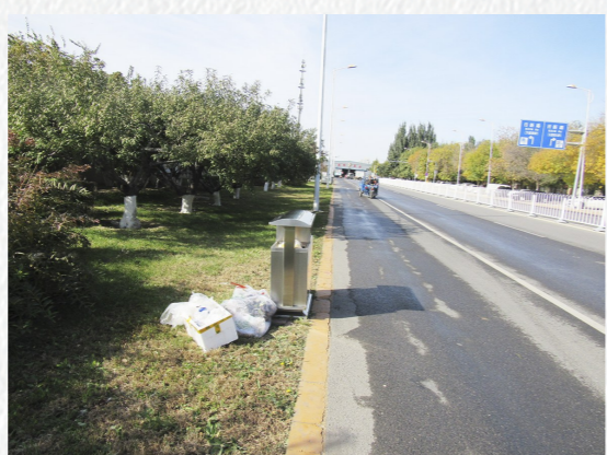
梨园镇万盛中二街生活垃圾