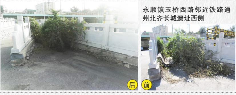
永顺镇玉桥西路邻近铁路通州北齐长城遗址西侧