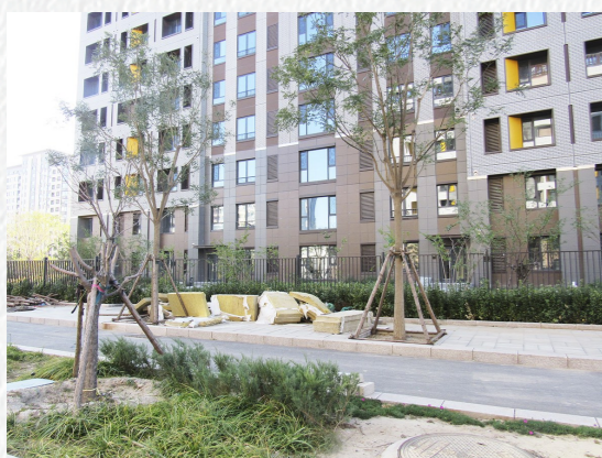
潞源街道潞源中街堆物堆料