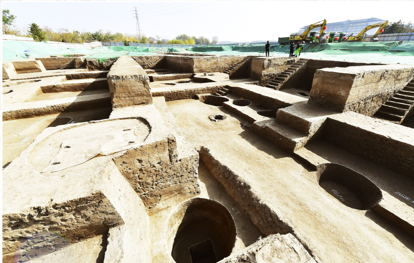
开工现场，一个个整齐的探方亮出来。

10月30日，潞县古城遗址保护展示工程正式开工建设，两年后，遗址上将落成一座专为考古遗迹量身打造的博物馆，让本地发现的遗迹不用挪地儿，原址原样呈现给世人。