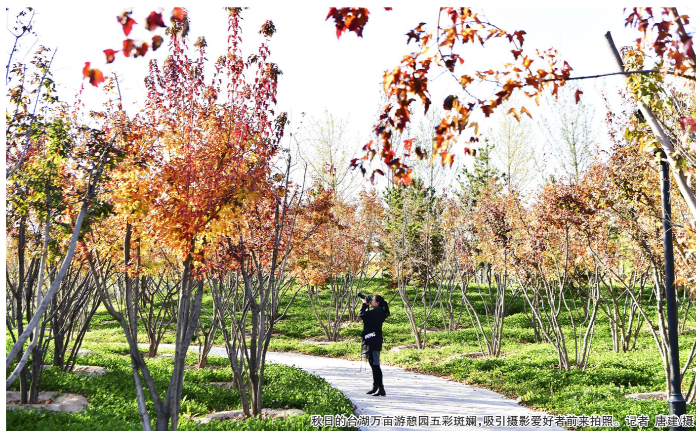
秋日的台湖万亩游憩园五彩斑斓,吸引摄影爱好者前来拍照。记者 唐建摄

本报讯(记者 陶涛 通讯员 曹杰)让森林走进城市,让城市拥抱森林,对于北京城市副中心的市民来说,已是触手可及的现实。记者昨天了解到,在台湖演艺小镇,一座整体规模相当于 2.5 个奥林匹克森林公园的大尺度城市森林景观——台湖万亩游憩园将于年底完成四期工程建设。届时,这座占地约 2.6 万亩的超大公园将成为城市副中心的又一座“天然氧吧”和“绿色空调”。 据介绍,台湖万亩游憩园是城市副中心西部生态带上的重要景观节点,是台湖演艺小镇生态功能的重要承载区,也是城市副中心疏解整治提升工作的重要成果。近年来,台湖镇通过推进疏解整治提升工作,拆除了 28 个村级工业大院,400 多万平方米各类散乱污厂房,腾退绿化场地 12000 多亩。 大尺度绿化成为腾退土地的优先选择。台湖万亩游憩园围绕台湖演艺小镇定位,将台湖镇多年平原造林成果整合起来,以森林演艺区为核心,向周边辐射形成多个主题功能区,打造全域景区化、集群式的景点布局和“一心一带十景区”空间结构。建设内容主要包括绿化种植、土方工程、庭院、灌溉及电气工程等,新植树种 86 种,乔灌木约 35 万株,突出“春花万枝,多彩森林”的景观特色。 台湖万亩游憩园分四期建设,已持续了三年多时间。一期为原有平原造林的改造提升,总面积 5005.1 亩,着力打造台湖公园景区、林中演艺景区。(下转 2 版)