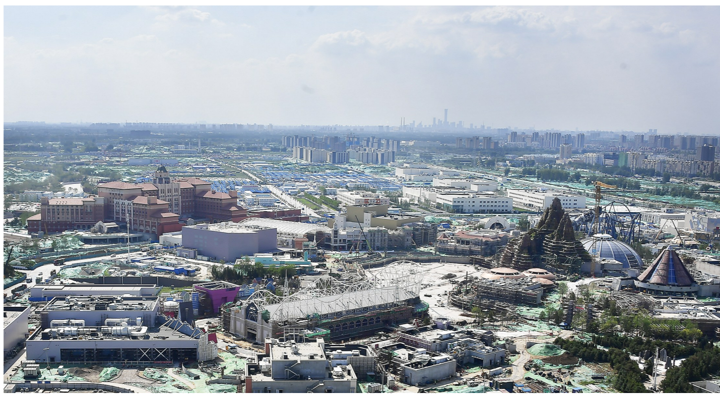
正在建设中的北京环球度假区将成为北京文化旅游新地标。

区启动了以“环球度假区全民试镜”为主题的抖音挑战赛活动。活动自10月19日开启,为期三周,分为两个阶段。在第一阶段“环球度假区舞神试镜”中,通过改编的环球主题公园内经典曲目,鼓励用户参与舞蹈挑战跳出玩心,打造全民热舞潮流。在第二阶段“环球度假区戏精试镜”中,北京环球度假区与抖音联合,基于主题园区的