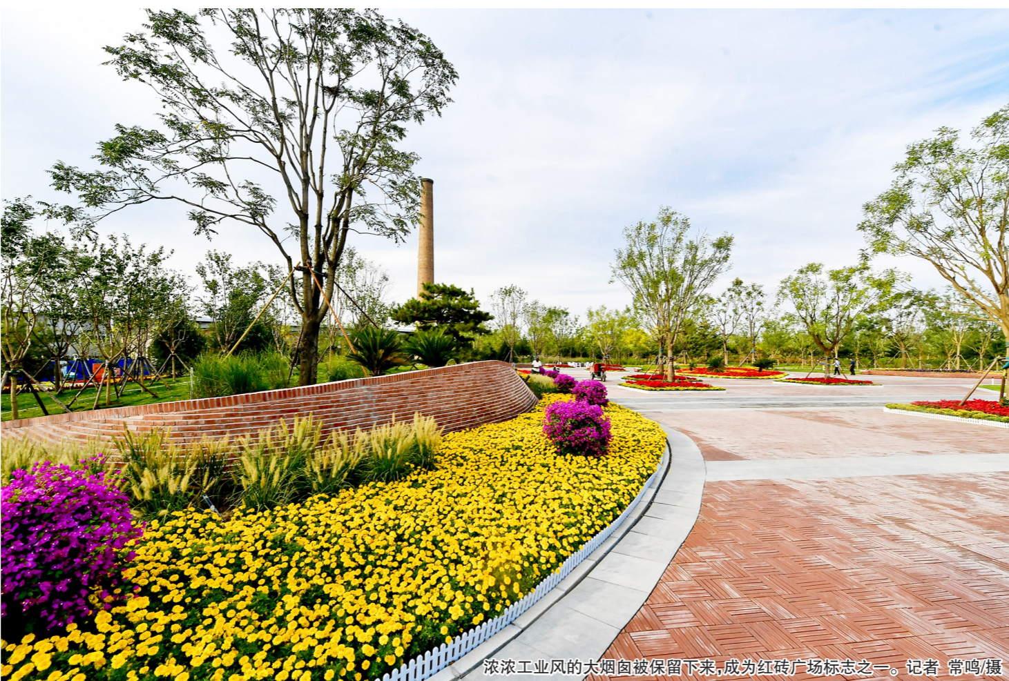
浓浓工业风的大烟囱被保留下来,成为红砖广场标志之一。