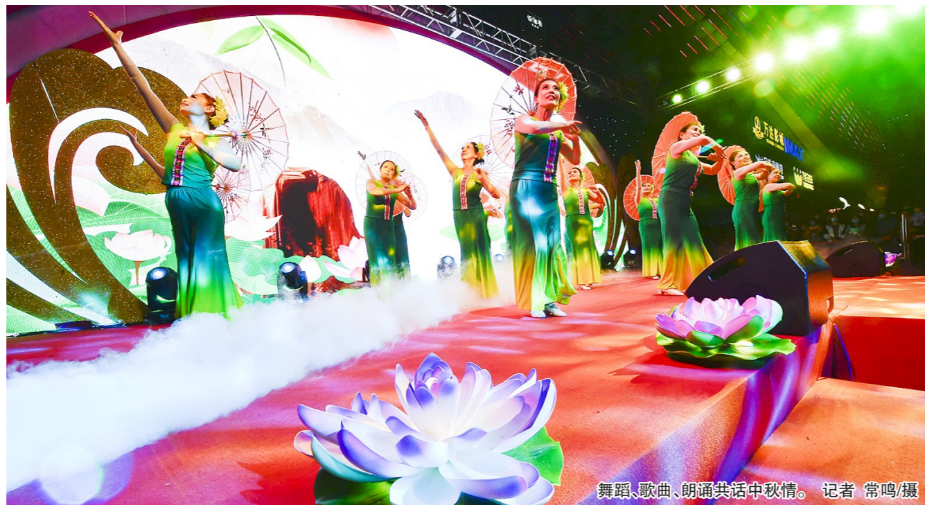
舞蹈、歌曲、朗诵共庆中秋情。