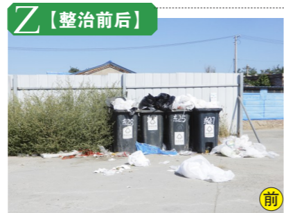
张家湾镇西定福庄村环湖小镇大鸭梨西侧生活垃圾

本期选取了5处上期挂账督办的环境问题，刊登整治前后对比照片，并对新发现的6处环境问题进行挂账督办。