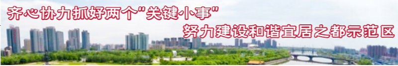
齐心协力抓好两个“关键小事” 努力建设和谐宜居之都示范区