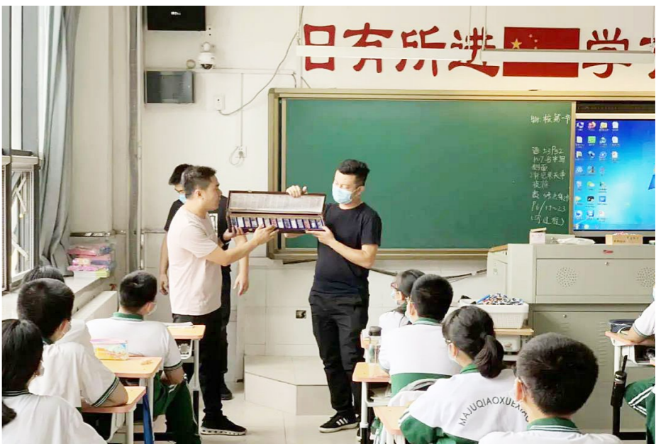
工作人员向同学们展示、讲解仿真毒品。