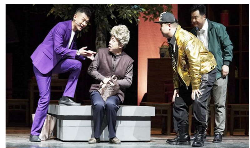
囊括“京味儿”和曲艺元素的相声剧《师·父》给市民带来欢笑。

据了解,2020台湖演艺艺术周自9月2日开幕,持续至20日。为期19天的演出时间里,共有10家演出院团带来15场高品质演出,涵盖交响乐、戏剧、杂技、歌舞晚会、相声剧等多种艺术形式。演出采取惠民低票价销售,设定160元、120元、80元和40元四档价位,吸引更多副中心城市走进剧院,乐享艺术。