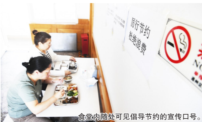
食堂内随处可见倡导节约的宣传口号。