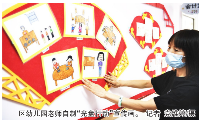
区幼儿园老师自制“光盘行动”宣传画。

勤俭节约是中华民族的传统美德,餐桌文明是城市文明的缩影。近日,我区多家餐馆、机关食堂、学校齐推“爱粮行动”,倡导大家餐餐“光盘”,培养公众养成“舌尖上的节约”,也传递了“舌尖上的美德”。