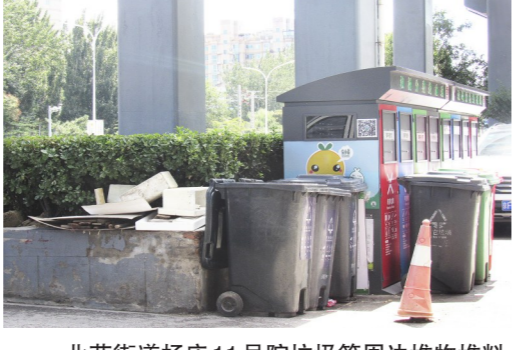
北苑街道杨庄11号院垃圾箱周边堆物堆料