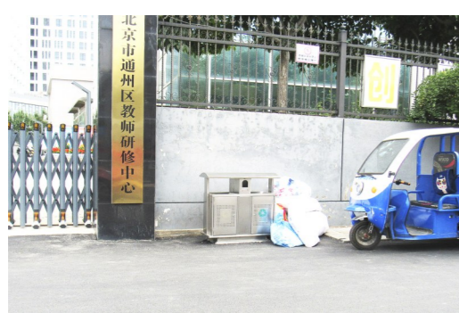
中仓街道上香胡同教师研修中心堆物堆料