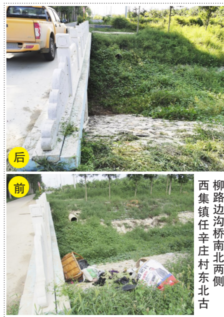
柳路边沟桥南北两侧