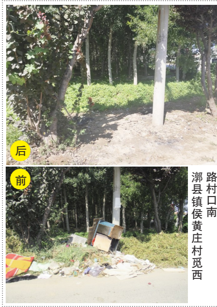
潮县镇侯黄庄村路西