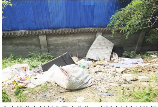
宋庄镇草寺村创意园路龙牌石膏板南侧生活垃圾建筑垃圾