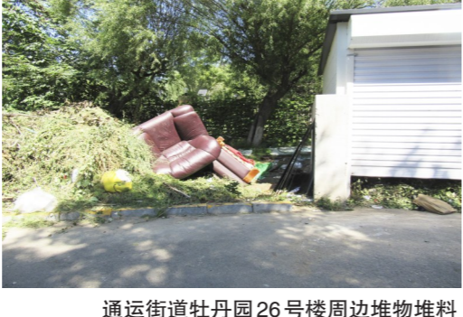
运河街道牡丹园26号楼周边堆物堆料