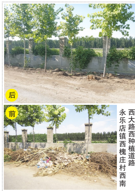
西乐店镇西槐庄村西南