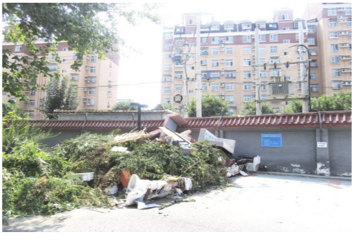
玉桥街道莽馨园45号楼西南角堆物堆料