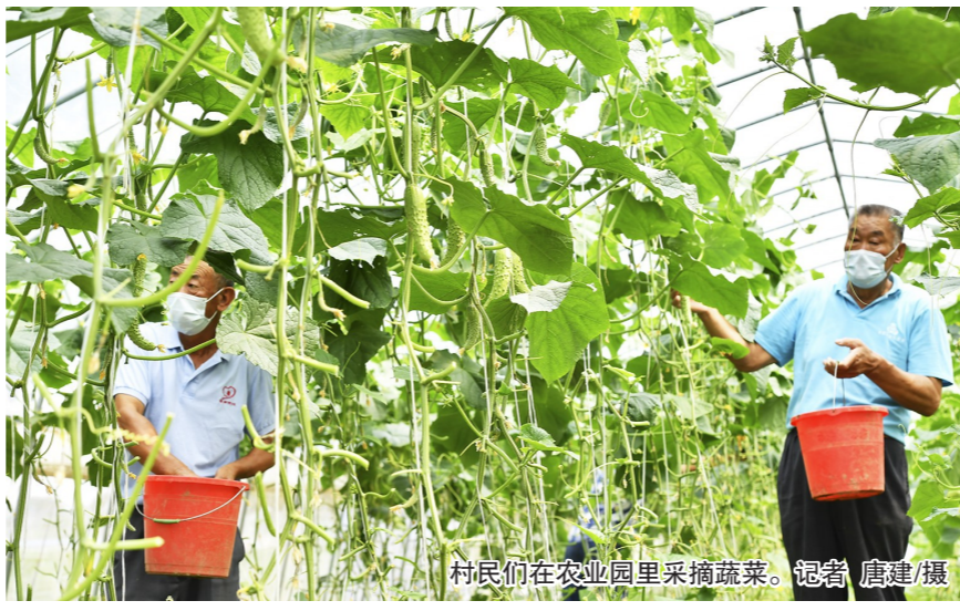
村民们在农业园里采摘蔬菜。

今年, 方恒集团再为车屯村提供帮扶资金, 帮助建设两座温室四季大棚, 助力村里发展规模化种植, 确保高端种