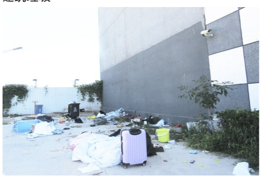
永顺镇范集路电商直播学院生活垃圾