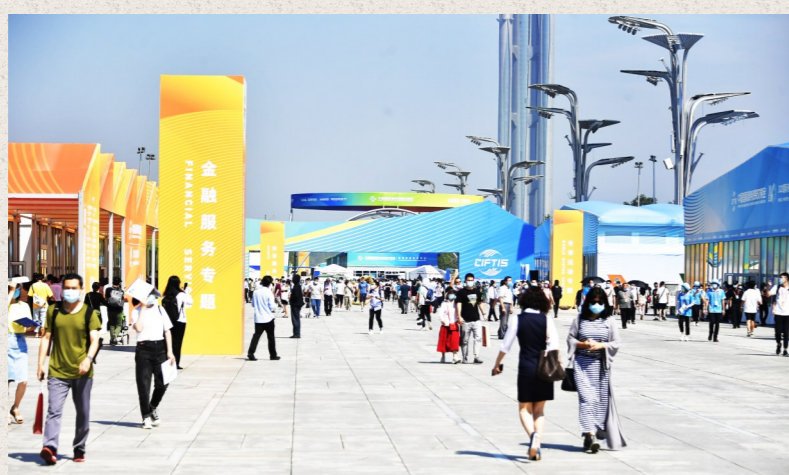
服贸会吸引众多观众前来观展，奥林匹克大道上人头攒动。