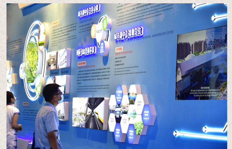
观众通过展板了解副中心战略定位、主导功能。