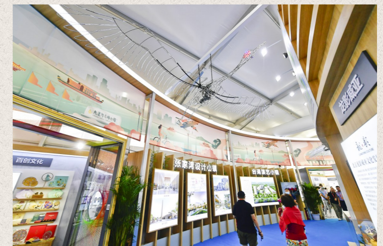
展台回廊串起设计小镇等重点项目推介区。