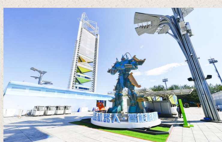
机器人展区外的巨型“孙悟空”格外吸睛。