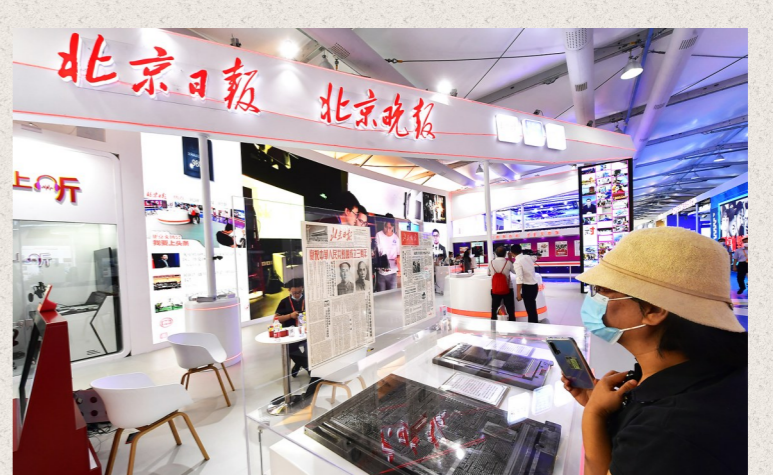
参观者观看铅字印刷版了解北京日报、北京晚报的历史。