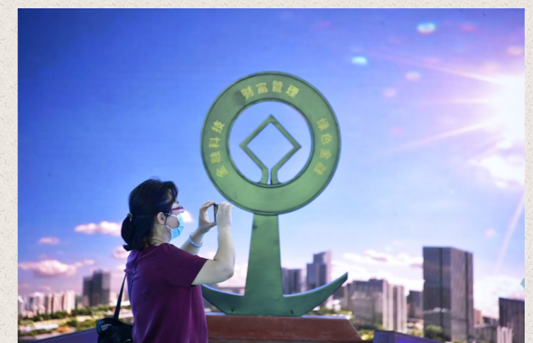
金融展台内可体验AR互动拍照、特效天幕等项目。