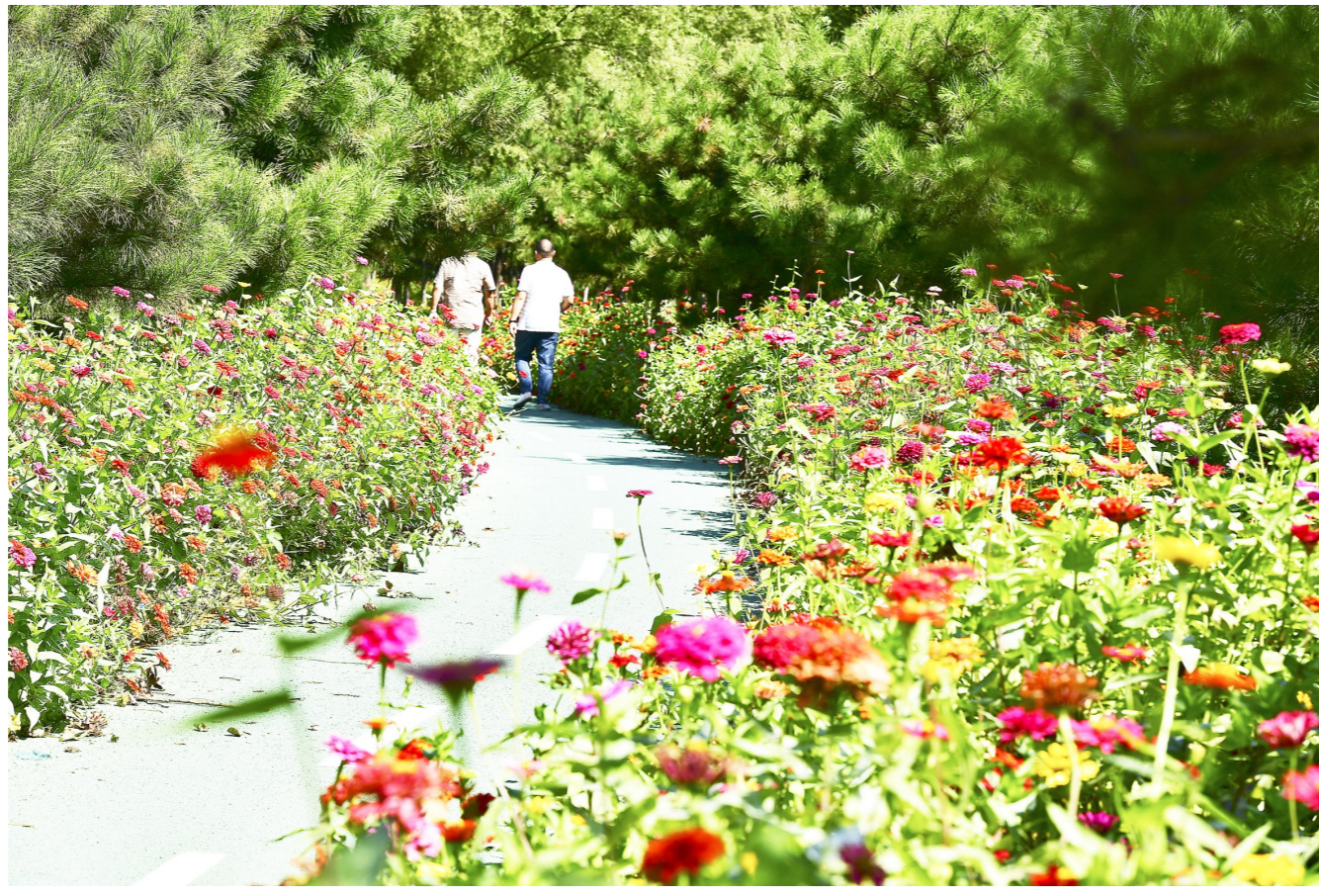
园内道路淹没在花海中。置身五彩花海,美不胜收。记者 唐建/摄

“按照副中心绿规构建‘两带一环一心’的总体构架,我们将在通州与北三县之间规划一条宽度不小于3公里、