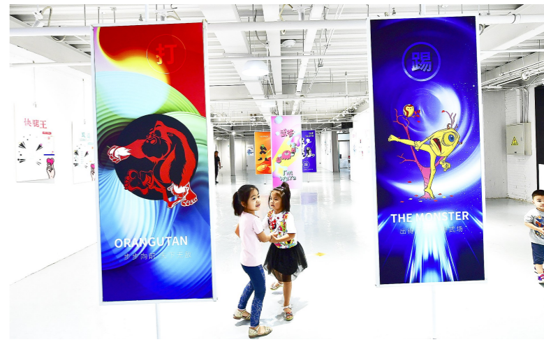
展览展示了综合武道、兵器大展等6大武术品牌项目模块。记者 唐建/摄

本报讯(记者 张丽)快摔王、刀王决、快腿王、武擒技……一个个功夫IP都有什么说法?9月6日,功夫IP授权展在九棵树文化产业园武局亲子武馆开幕。创新又不失传统,时尚还兼顾创造潮流,这里或许有您要的答案。