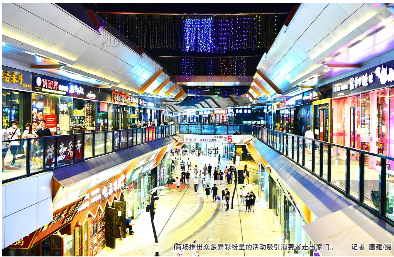
商场推出众多异彩纷呈的活动吸引消费者走出家门。

就在各个商超摩拳擦掌大战消费季时,夜经济也红火起来。在九棵树商圈里,东部文创产业园别具特色,不仅有网红酒馆胡桃里,还有W STAR SPACE等酒吧。夜幕之下,三五好友喝