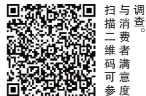
扫描二维码参与调查,提交维权难点痛点问题及意见建议。

促有关企业整改落实,为消费者提供优质产品和优质服务,促进消费提档升级,增强消费信心。