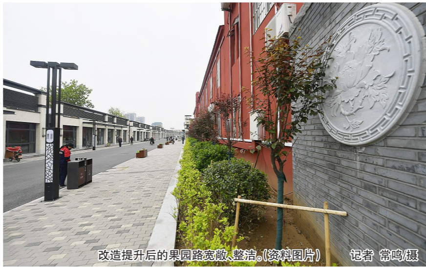
改造提升后的果园路宽敞、整洁。(资料图片) 记者 常鸣/摄

本报讯(记者 张楠)“复兴里西望,红花婀娜藏,嫩植掩映红砖墙。果园大街上,打造新街巷,后街芳香悠绽放……”一部展示副中心背街小巷三年整治成果的原创音乐MV,在区城管委微博“通州城市管理”上正式对外发布,用歌声邀请市民来副中心“美颜”后的背街小巷游览。记者了解到,从今年起三年时间里,我区将对168条背街小巷进行“精细化”整治提升。 过去三年,全区共有140条背街小巷完成了整治提升。自此,城区的背街小巷基本整治提升完毕。为了杜绝“千街