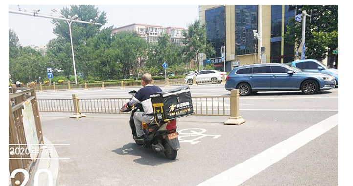
通州大街与芙蓉东路交叉口。

文明是城市最美的风景。文明有序、和谐畅通的道路交通环境需要每一位居民积极参与。让我们共同行动，抵制行人闯红灯、非机动车闯红灯、乱穿马路、非机动车逆行四大不文明交通行为。