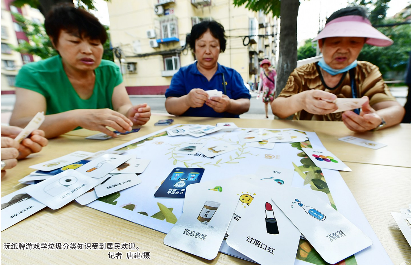
玩纸牌游戏学垃圾分类知识受到居民欢迎。

在垃圾分类实践中，一些居民反映，没有生活垃圾暂存点和大件垃圾存放点不方便，而且容易让社区垃圾外溢，环境显得不整洁。这个问题在玉桥南里小区得到了很好的解决。记者在小区内看