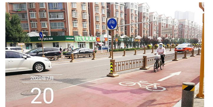
玉带河大街与玉桥中路交叉口。