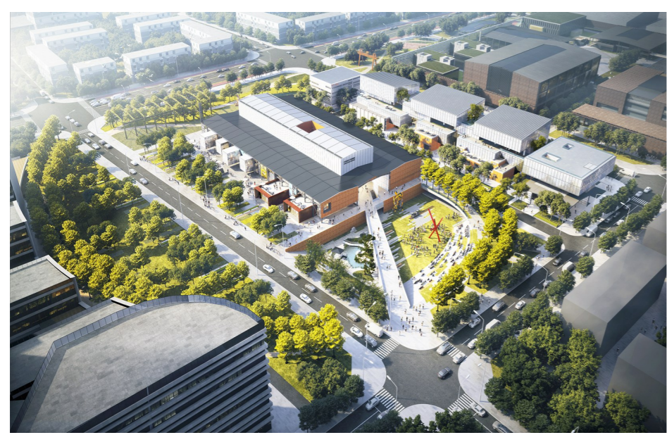
位于张家湾设计小镇的北泡轻钢项目北侧地块鸟瞰图。(效果图)