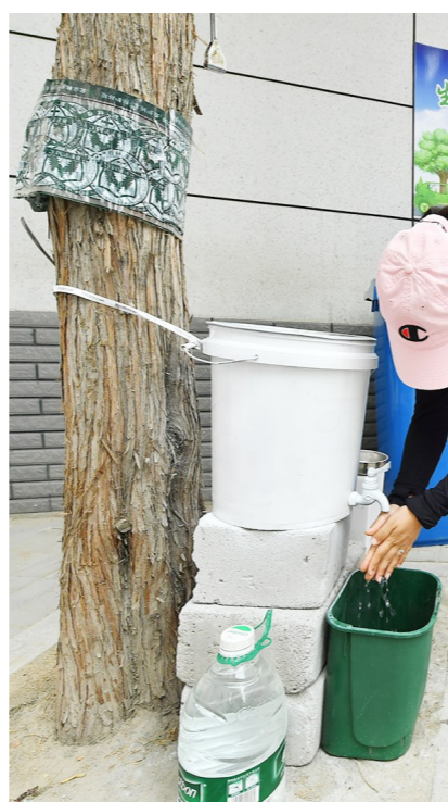
小小洗手桶给居民带来了便利。