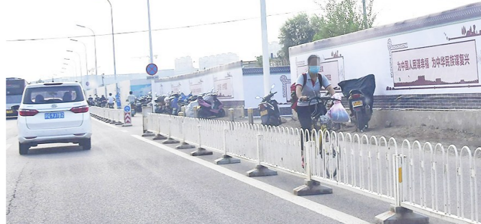
一位市民骑车逆行。

开栏语:当前,我区持续推进全国文明城区常态化建设,在各相关部门以及广大市民的参与和努力下,我们的城市正在变得更美丽、更和谐。