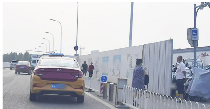
潞城地铁站,一河北出租车违规占道等客。