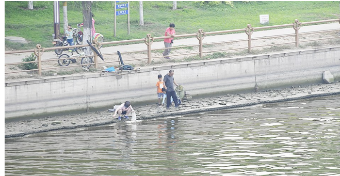
运河大桥下,几位市民在河道内捞鱼。