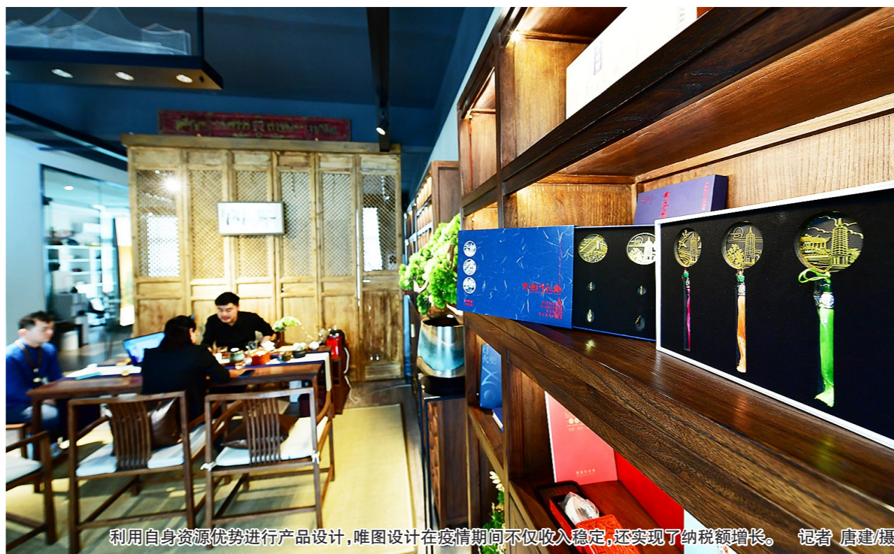
利用自身资源优势进行产品设计,唯图设计在疫情期间不仅收入稳定,还实现了纳税额增长。

深耕游戏领域整合营销服务的北京思恩客科技有限公司是通州区创意设计服务业中规模较大的企业代表。其主