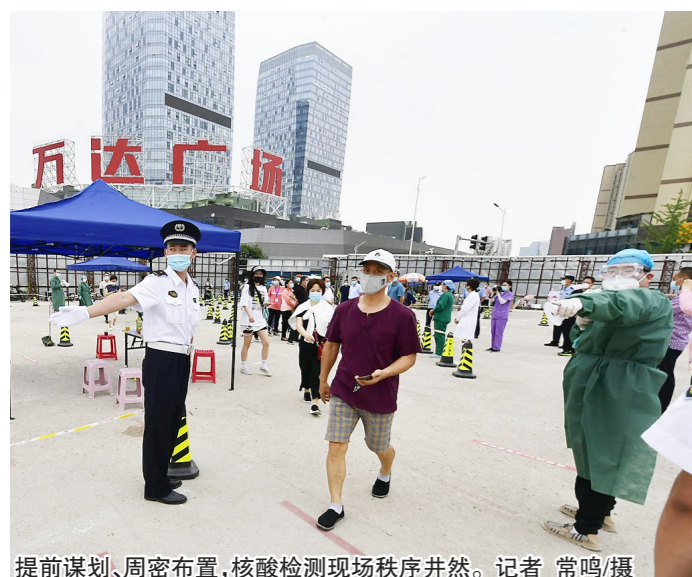
提前谋划、周密布置,核酸检测现场秩序井然。

“25处采样场所,224个点位,1892名医护人员轮流上阵,5000余人次服务保障力量……面对新增的1例本地新冠肺炎确诊病例,北苑街道坚持党建引领,严格社区管控,扩大核酸检测范围,9天,核酸检测采样7.6万余人次,坚决守护群众健康安全。”