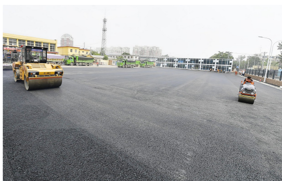
站前公交场站各项工程基本完工。

本报讯(记者 冯维静)通州西站交通接驳整治工程今天将全部完工。6月30日,市郊铁路京承线将开通,通州西站将与市郊铁路京承线无缝衔接,成为继市郊铁路副中心线后开通的第二条市郊铁路。